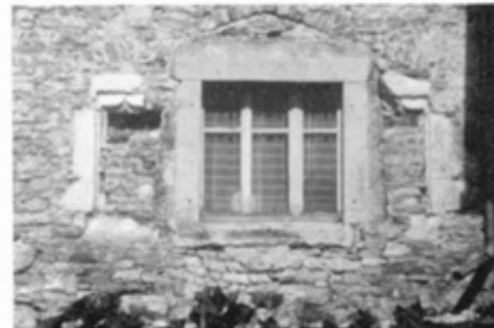
•Des maisons dont on prenait soin

Proche de l'autarcie, La vie sociale et économique était intense, confinée au village. Les multiples tâches de l'agriculture ainsi que l'entraide individuelle, monnayée ou non, étaient une nécessité depuis des générations.