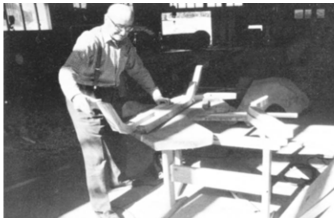
Manière d'ajuster les « courbes » qui se rejoignent par paire sur la ligne médiane. Par contre les « traversaux » sont d'une seule pièce et vont d'un bord à l'autre du plancher.