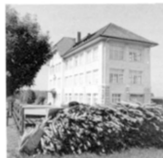
•La vie commence à changer

Les premiers signes du changement social et économique dans l'environnement construit apparaissent vers 1900 et s'échelonnent jusqu'en 1939 : d'abord, pose des lignes électriques, construction d " une fabrique d'horlogerie, de petites maisons familiales non paysannes, ensuite amenée de l ' eau courante et abandon des citernes, asphaltage des routes, enfin avec les premières cessations d'exploitation, disparition de fumiers, de greniers et de remises. (...)