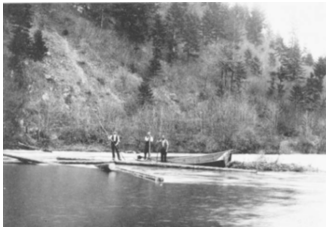
Scène de flottage au Moulin Jeannotat en 1912. La barque est coincée entre le barrage et les grumes, ce qui démontre les dangers de ce métier.