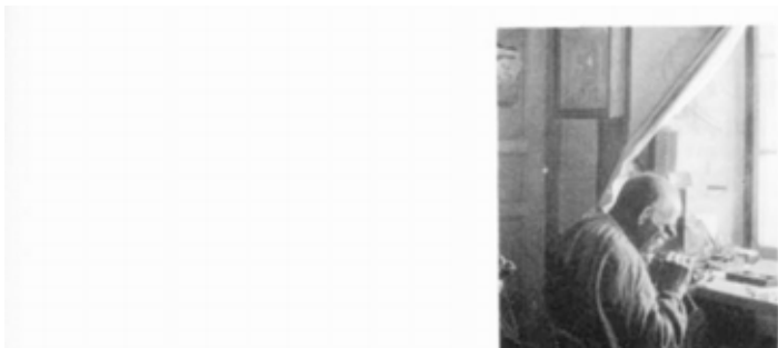
•Des familles de paysans-artisans

Au début du siècle encore, une même famille de trois générations se partageait le même logement dans une ferme. Cette famille exerçait, outre l'agriculture, diverses activités complémentaires. Un tel était forgeron, tonnelier ou tailleur. Dans la plupart des cas une personne au moins travaillait à l'établi d'horloger, à domicile ou dans un atelier familial créé dans l'une ou l'autre des fermes du village.