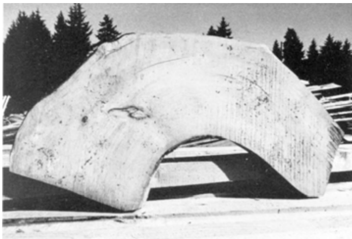
Les «courbes» qui constituent l'ossature de la barque seront découpés dans des planches de bois dur de 5 cm d'épaisseur ou tout autre tronc ayant déjà la forme voulue naturellement.