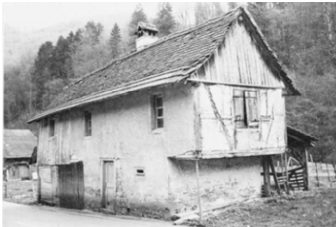
Avant... Le 12 juillet 1981.

Jusqu'à une époque très proche de nous on se souciait bien peu de conserver les anciens bâtiments. Et pour cause: l'inutile ou plutôt l'inutilisable était supprimé et l'on reconstruisait selon les mêmes canons et avec les mêmes matériaux. Il s'agissait en quelque sorte d'une simple substitution. A partir du moment où technique de construction, matériaux et finalité des maisons sont remis radicalement en question - par commodité ce moment peut être fixé à la première Guerre mondiale - les maisons anciennes se voient abandonnées, oubliées, rasées. Sans être remplacées. Leur nombre se résorbe comme peau de chagrin, d'autant plus si leur espèce est rare, en tout cas raréfiée. Nos contemporains sont en train de vivre ce phénomène avec une douloureuse acuité. Ils ont le pénible privilège de décider de la survie de tel ou tel témoin construit du passé. C'est le pain quotidien de l'ASPRUJ et, à une échelle plus modeste, de son relai le plus efficace en terre ajoulote, l'ASB ou Association pour la sauvegarde de la Baroche.