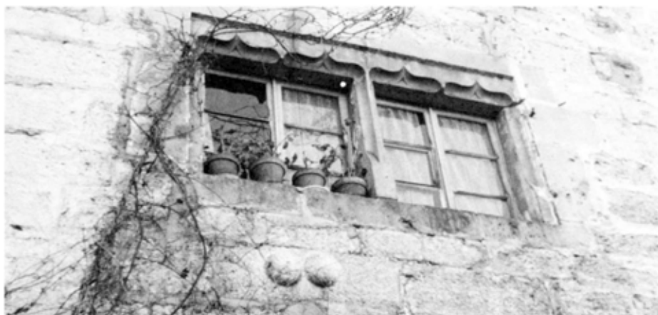
Double boule au milieu de la façade de