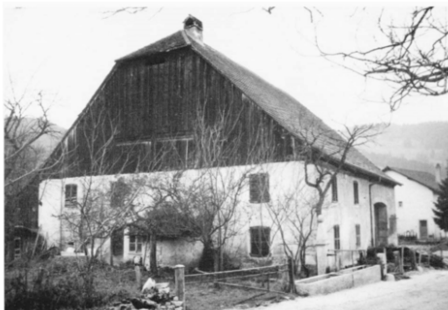
Glovelier, «La Djinie». Dans de nombreux cas, le bâtiment où se disait la messe pendant le Kulturkampf est un élément marquant du site villageois.

particulièrement marquée au cours du XIX e siècle. Sans entrer ici dans les détails, on peut rappeler que l'Eglise catholique s'est trouvée opposée au radicalisme démocratique, aussi bien pour des questions de doctrine que d'organisation. L'opposition devint manifeste avec la publication du Syllabus, en 1864, document qui fait la liste des thèses considérées comme pernicieuses par l'Eglise catholique. Dans le diocèse de Bâle, la lutte fut particulièrement aiguë. En (...)