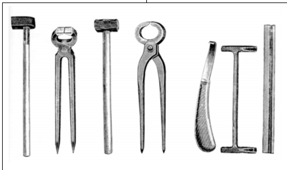
Brochoir Triçoise Mailloche Pince à déferer Rénette Gonge Rogne-pieds