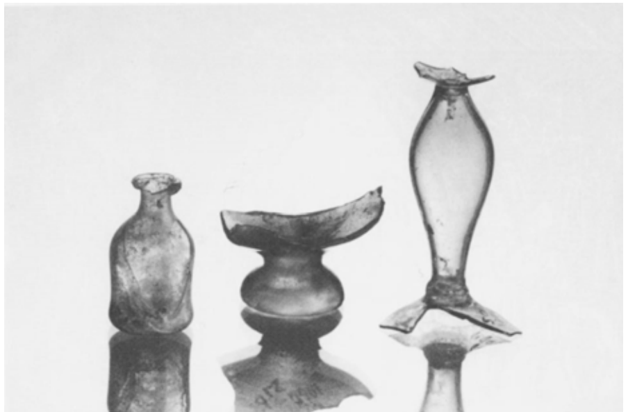
Déchets de verre, trouvés lors de fouilles archéologiques, au Chaluet, près de Court, où plusieurs verreries étaient en activité au XVIII e siècle.

» Tous les creusets doivent être remplis à propos, en même temps et de la (...)