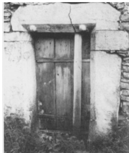
Deux boules sur le linteau de la porte de l'écurie de l'ancienne maison Jourdain XVI e , aux Genevez.

J'en ai trouvé aussi autour des portails (Loewembourg), des portes d'entrée (Gléresse), voire des portes d'écuries (Les Genevez) ; rarement au milieu des façades (Le Bizot); le plus souvent sur des maisons isolées ou bâties à l'entrée des villages. Il y en a également sur des (...)