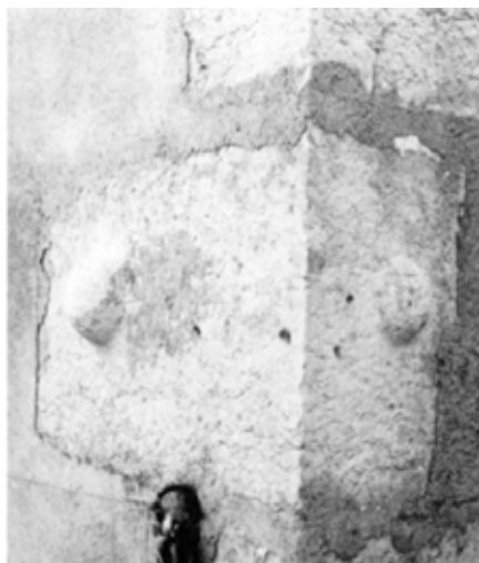
Boules apotropaïques à l'angle S-E de la maison 46 de la Rangée-des-Robert, La Ferrière.