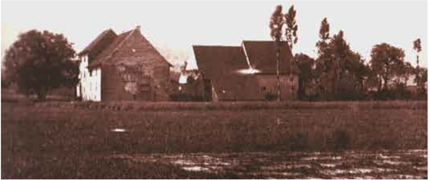
Vue nord du château, photo d'Auguste Quiquerez, en 1865 (Musée cantonal d'art et d'histoire, Delémont).