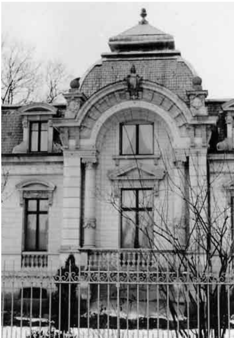
Voûte centrale de la façade sud de la villa.

Dans son bulletin annuel N° 27, de 2003, L'Hôtâ fait la preuve de son attachement envers le patrimoine artistique du Jura, par la publication d'une étude 1 richement illustrée, axée sur de splendides demeures en ville de Porrentruy, œuvres méritoires d'un architecte ajoulot, Pierre-Joseph Maurice Vallat (1860-1910), lui-même fils d'un architecte. Ce personnage s'était rendu à Paris et fut admis à l'École des Beaux-Arts où il consacra ses études à l'architecture jusqu'en 1891. Rentré au pays, il fut le concepteur et le réalisateur de magnifiques maisons de maître en ville de Porrentruy. Elles témoignent toutes de sa dextérité et de son sens du Beau. Très éclectique, il est l'auteur de belles villas, dont celle de la famille Burger construite en 1898, chacune dans un style architectural différent, mais toutes inspirées de styles classiques. On ne peut donc lui appliquer les qualités de créateur d'un style personnel, contrairement à l'architecte neuchâtelois Le Corbusier, dit «Corbu», alias Charles-Edouard Jeanneret ou à Frank Lloyd Wright, ce qui ne diminue en rien ses qualités de concepteur. (...)