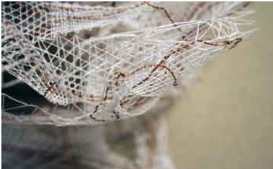
Le nid, détail, Nicole Rousselle, Delémont. Dentelle aux fuseaux, fils lin et métallisé cuivre. Exposition des dentellières jurassiennes, ARTsenal, Delémont, juillet 2006.

Faite des lins les plus beaux, la dentelle apparaît au XVI e siècle en Italie et dans les Flandres. Arrivée en France avec Catherine de Médicis, l'épouse du roi Henri II, elle séduit la noblesse et connaît un succès spectaculaire dans ce pays. Les premières parures sont faites pour les hommes qui partent en guerre ornés de dentelles autour du cou, aux poignets et au bas de leur culotte. Jusqu'à la Révolution française, le costume masculin sera ainsi rehaussé de dentelles.