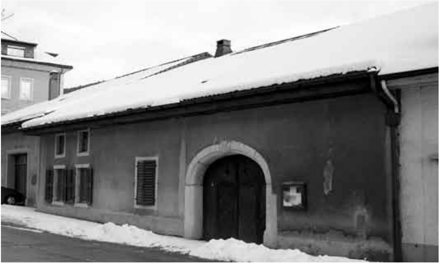
La façade sur rue. On devine les deux maisons mitoyennes. Mars 2006.